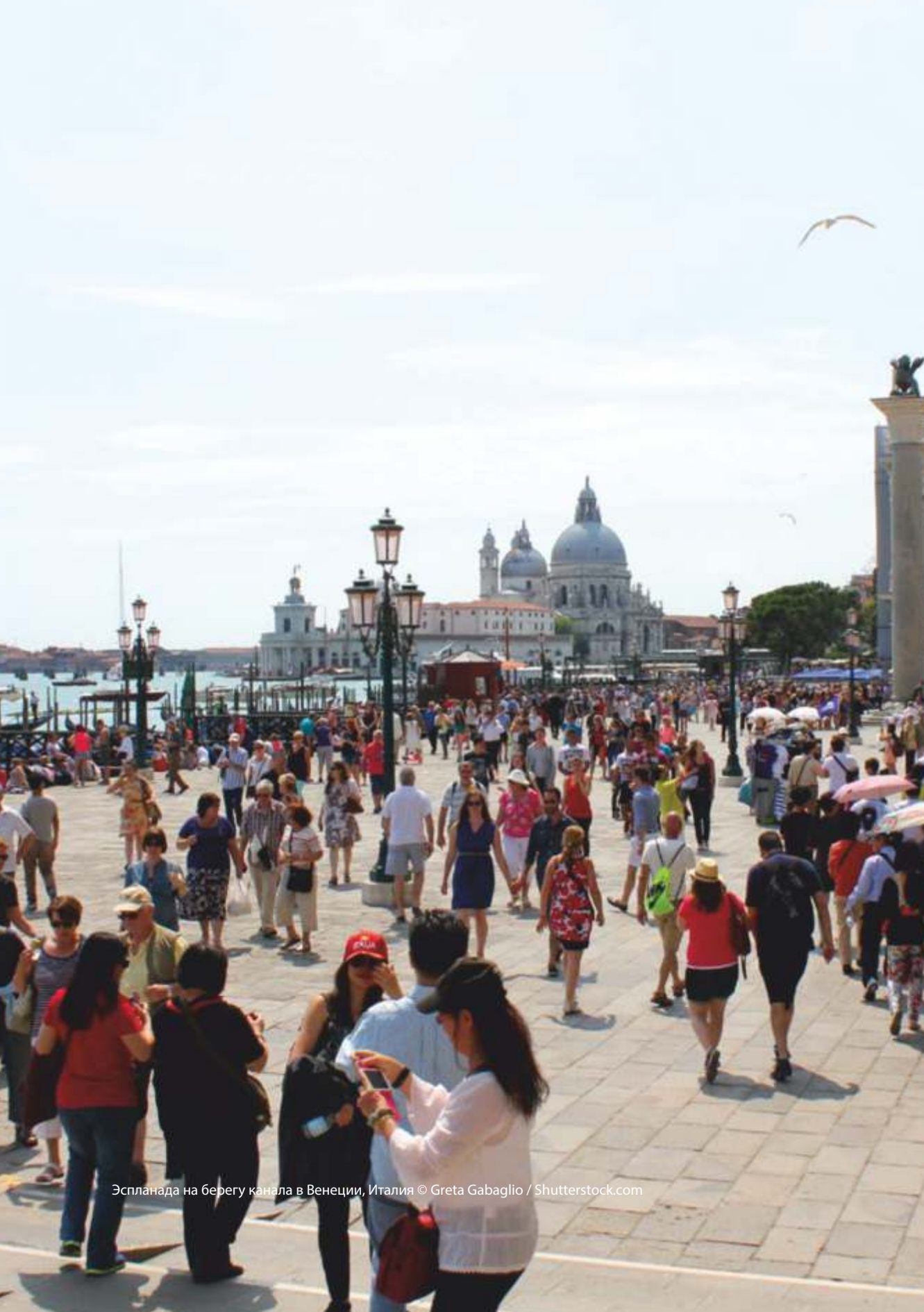
Эспланада на берегу канала в Венеции, Италия