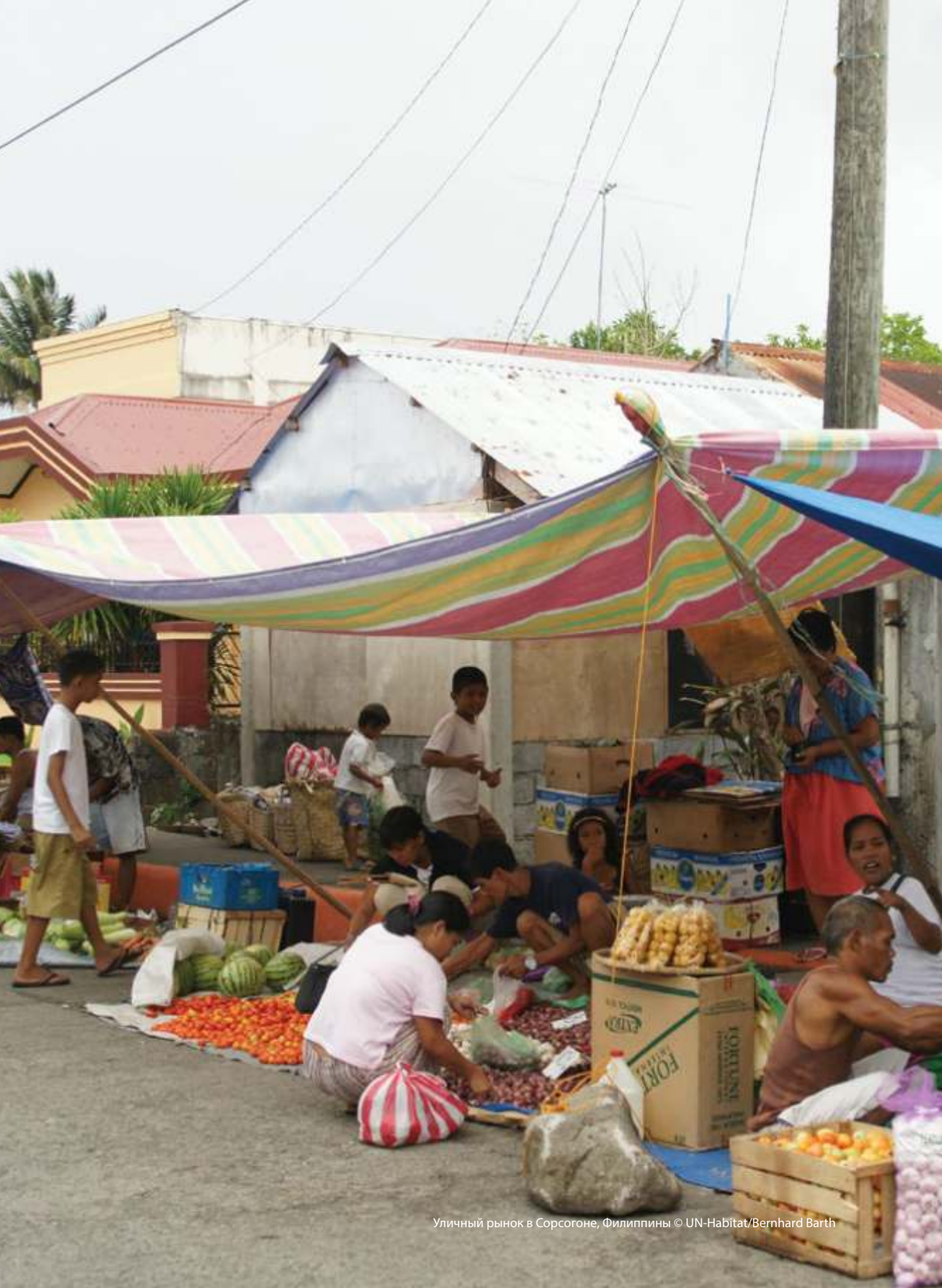
Уличный рынок в Сорогоне, Филиппины