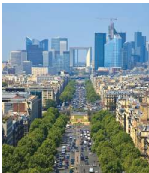
Авеню Шарля де Голля и площадь Дефанс, Париж, Франция

Гражданское ответственное руководство – осуществление деятельности или работы по обеспечению контроля, защиты и соблюдения ответственности в отношении того, что считается заслуживающим внимания и сохранения.