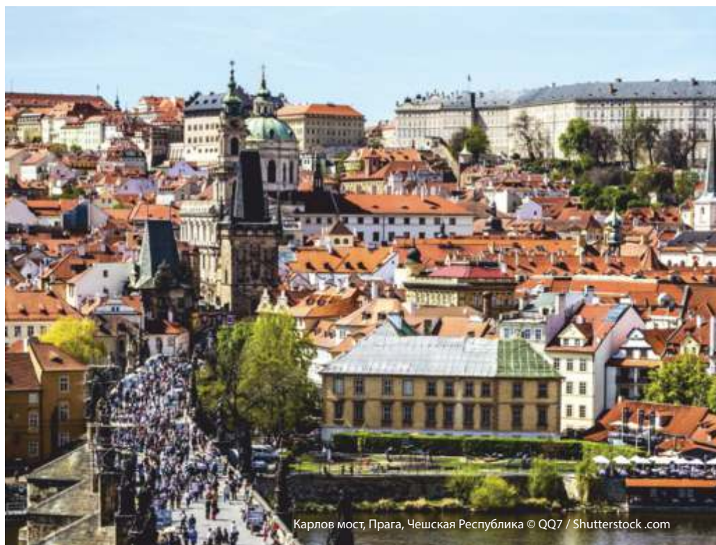
Карлов мост, Прага, Чешская Республика

В 2014 году лауреатом премии Американской ассоциации планирования знаменитых общественных мест стал рынок «Рединг терминал маркет», Филадельфия. Рынок расположен в комплексе зданий, известном как Железнодорожный вокзал, к нему легко проехать общественным транспортом, в этом торговом центре ведут торговлю свыше 76 малых торговых предприятий. Ежегодно рынок посещают свыше 6 миллионов человек, доходы от реализации товаров поступают в оборот снова в этом же регионе.