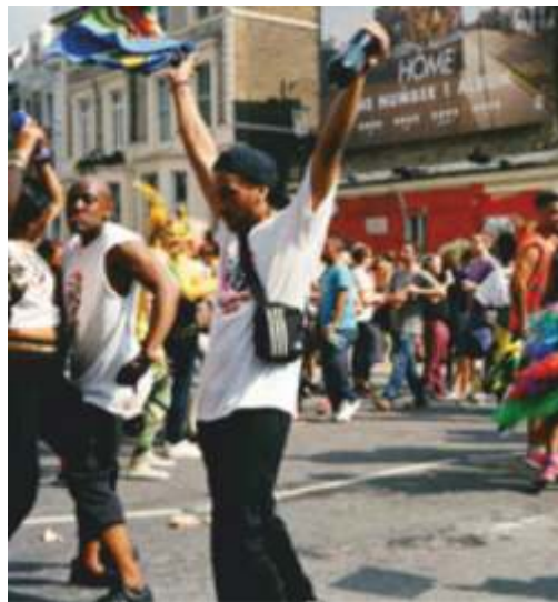
Карнавал в районе Ноттинг-Хилл, Лондон, Великобритания

Карнавал в Ноттинг-Хилле – крупнейший уличный фестиваль в Европе. Впервые он состоялся в 1964 году как праздник местного населения, выходцев из стран Африки и Карибского бассейна, решивших отметить таким образом свои культурные достижения и традиции. Ноттинг-Хиллский карнавал проводится ежегодно в августе месяце, которые называют «банковские каникулы», в выходные дни, на улицах городского района London W11, проходит в красочной и шумной обстановке и служит примером проявления социальной солидарности.