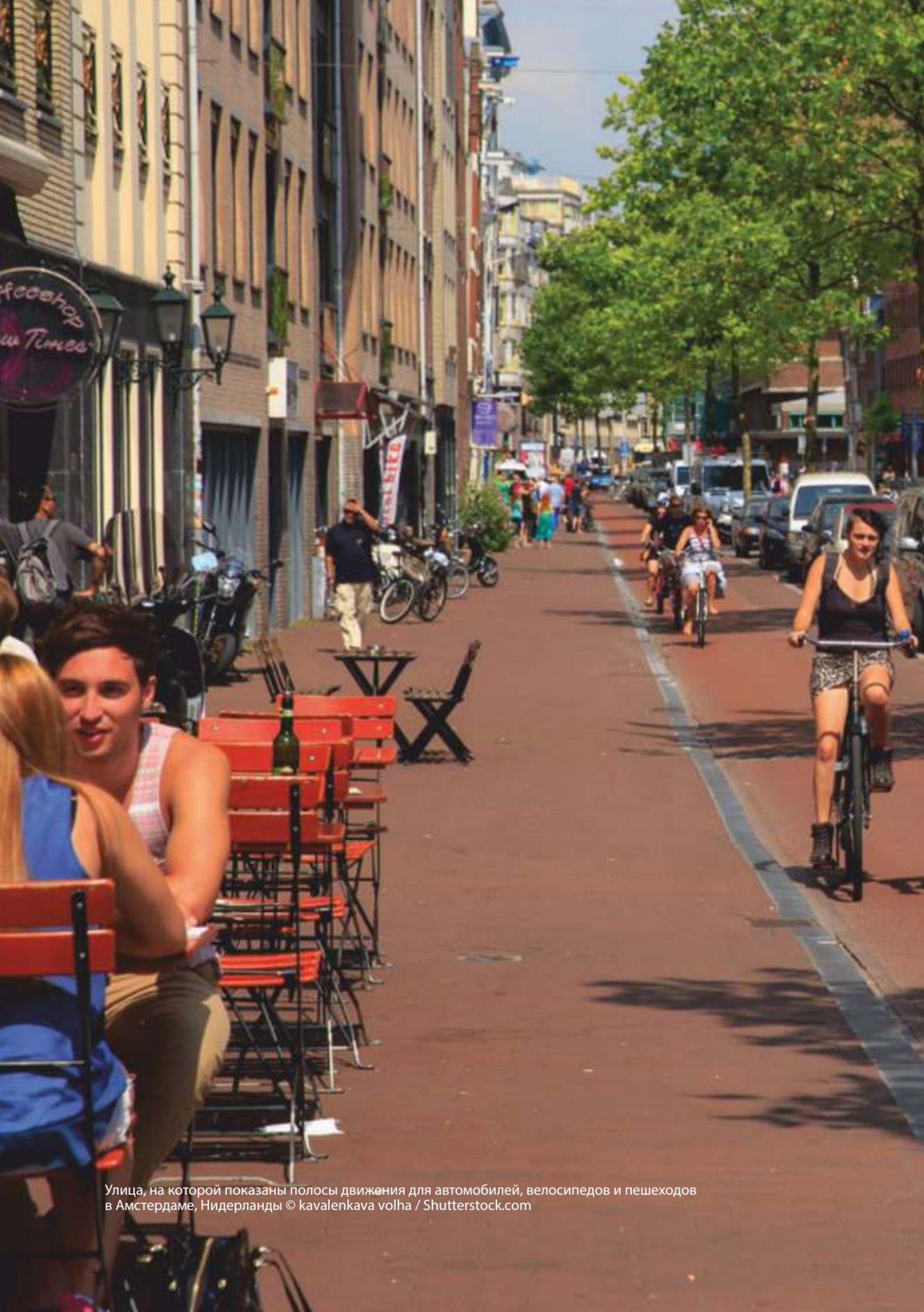
Улица, на которой показаны полосы движения для автомобилей, велосипедов и пешеходов в Амстердаме, Нидерланды