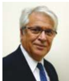
Dr. Joan Clos

Общественное пространство способствует формированию культурных, социально-экономических и политических функций городов. Эти функции сохраняют свое значение как главный элемент, определяющий статус конкретных мест, начиная с хаотичной застройки населенного пункта без планировки и кончая созданием малого или большого города с высокой репутацией.