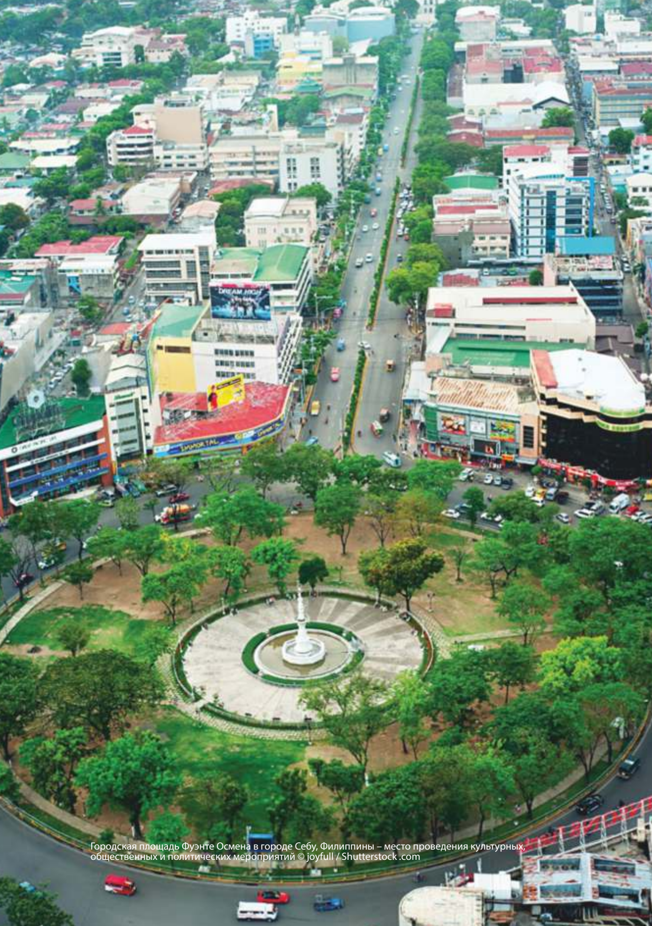
Городская площадь Фуэнте Осмена в городе Себу, Филиппины – место проведения культурных, общественных и политических мероприятий