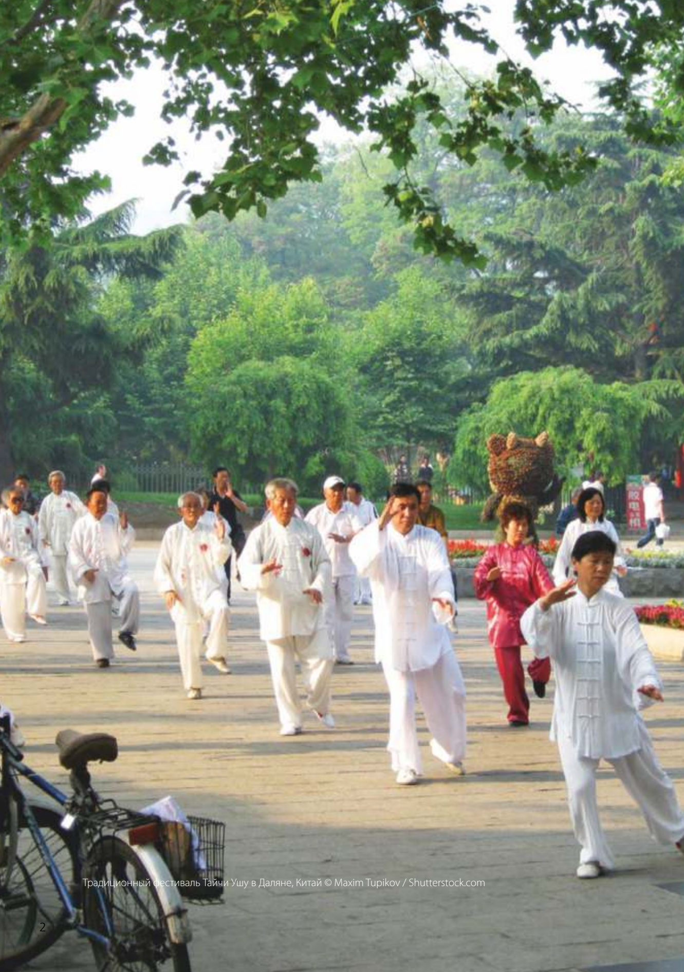
Традиционный фестиваль Тайчи Ушу в Даляне, Китай