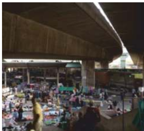
Рынок на Уорикском вокзале, Дурбан, Южная Африка

В результате реализации Проекта реконструкции рынка на Уорикском вокзале были достигнуты значительные