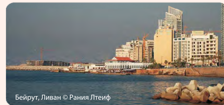
Бейрут, Ливан