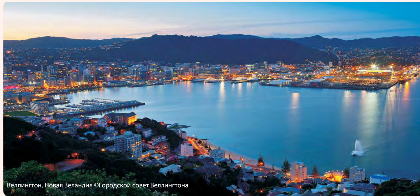
Веллингтон, Новая Зеландия