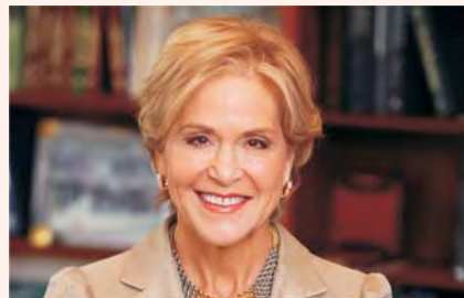
Д-р Джудит Роден, 12-й президент Фонда Рокфеллера, в настоящее время фонд входит в «Медельинское сотрудничество по жизнеспособности городов»

Мы не можем предсказать, какое стрессовое событие может произойти в ближайшее время, но благодаря повышению жизнеспособности городов можно смягчить последствия причиненного ущерба и разрушения. В следующем веке, возможно, именно в этом и будет состоять разница между городами, которые процветают и которые просто выживают.