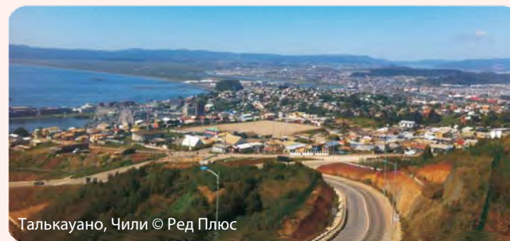
Талькауано, Чили