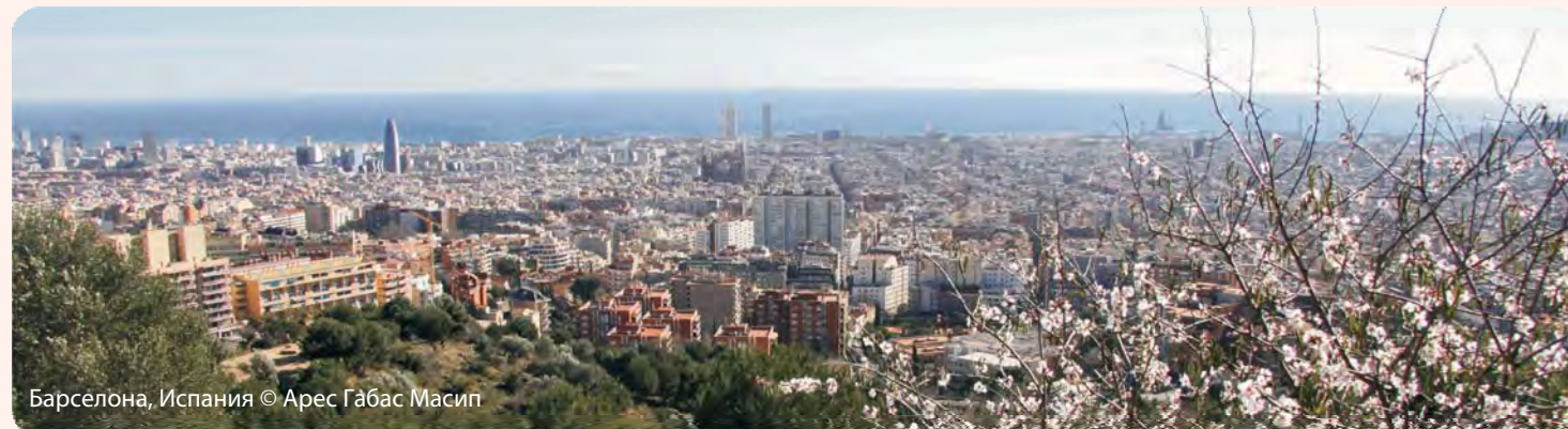
Барселона, Испания © Арес Габас Масип