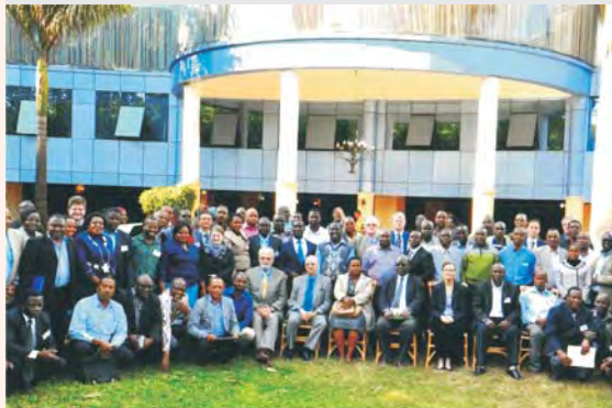
Коллективы ППЖГ и ВБ на открытии семинара «Академия кредитоспособности» в Танзании