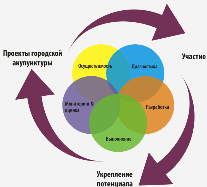
Диаграмма национальной городской политики